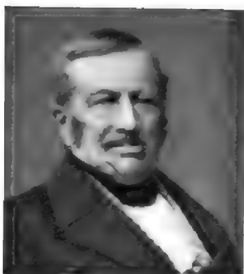
10. H. W. DE QUARTEL. (1782.—1863)